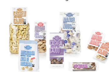
FEINKOST Sortiment von Pakka.

Die PAKKA AG wurde 2006 von zwei Jungunternehmern, einem Agronomen und einem Forstwirt, in Zürich gegründet, um nachhaltige Lieferketten für Nüsse aus Entwicklungsländern in die Schweiz und nach Europa aufzubauen. Das Sortiment umfasst heute Cashew-Nüsse aus Indien, Mandeln aus Palästina und Pakistan, Erdnüsse aus China, Macadamia aus Kenia, Paranüsse aus Bolivien und neuerdings auch Haselnüsse aus Georgien. Der Ver-